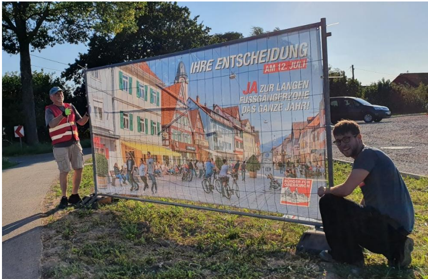
Aufstellen von Plakatwänden um die Bürger auf die bevorstehende Wahl am 12. Juli aufmerksam zu machen.