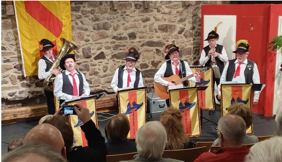
Demokratie wagen? Baden 1818-1819 / Eröffnung der Ausstellung im Heimat- und Grimmelshausenmuseum